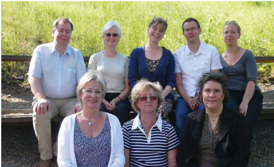
Personalen sommaren 2007

Rekrytering av Kvalitetsansvarig påbörjades under hösten. Det arbetet pågår och förväntas vara klart i början av 2008.