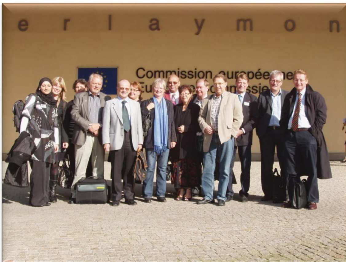
Styrelsen utanför Europakommissionen

Vid mötena framkom ett behov av att i EU ytterligare tydliggöra vad folkbildning är. Sverige ligger inom EU bäst till när det gäller hur stor andel av befolkningen som deltar i livslångt lärande, vilket naturligtvis folkbildningen kan ta åt sig en stor ära för, men i EU ses folkbildningen som en organisationsform.